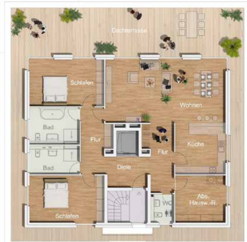
Varinante 01 | 190 m 2