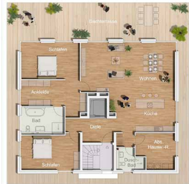
Varinante 03 | 190 m 2