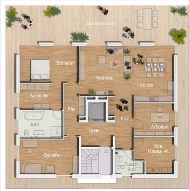
Varinante 02 | 190 m 2

GESTALTUNGSVARIANTEN FÜR BEIDE PENTHÄUSER